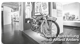
Sachs Ausstellung @ Anand Anders

Julius-Echter-Renaissanceschloss Zum denkmalgeschützten Anwesen gehören neben dem beeindruckenden dreigeschossigen Renaissance-schloss mit Zehntgefängnis ein Innenhof, umgeben von einer mächtigen Scheune, Wirtschaftsgebäuden und mauer-geschützten Gartenanlagen. Kirchberg 11, Oberschwarzach