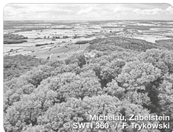
Michelau, Zabelstein

TreffpunktDeutschland.de/schweinfurt-region