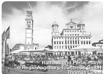
Ratnaus und Perlachturm