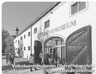
Volkskundemuseum Oberschönenfeld