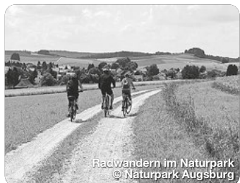
Radwandern im Naturpark

TreffpunktDeutschland.de/augsburger-land