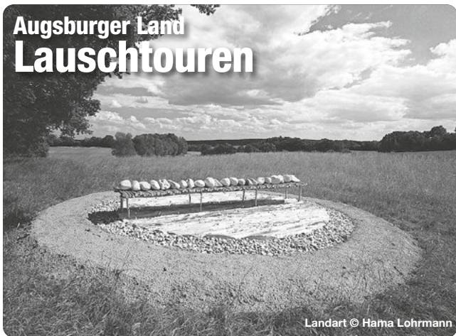
Landart © Hama Lohrmann

Bei den Augsburger Sommernächten verwandeln sich die Plätze, Höfe und Straßen der Innenstadt in eine charmante, aufregende und abwechslungsreiche Festzone.